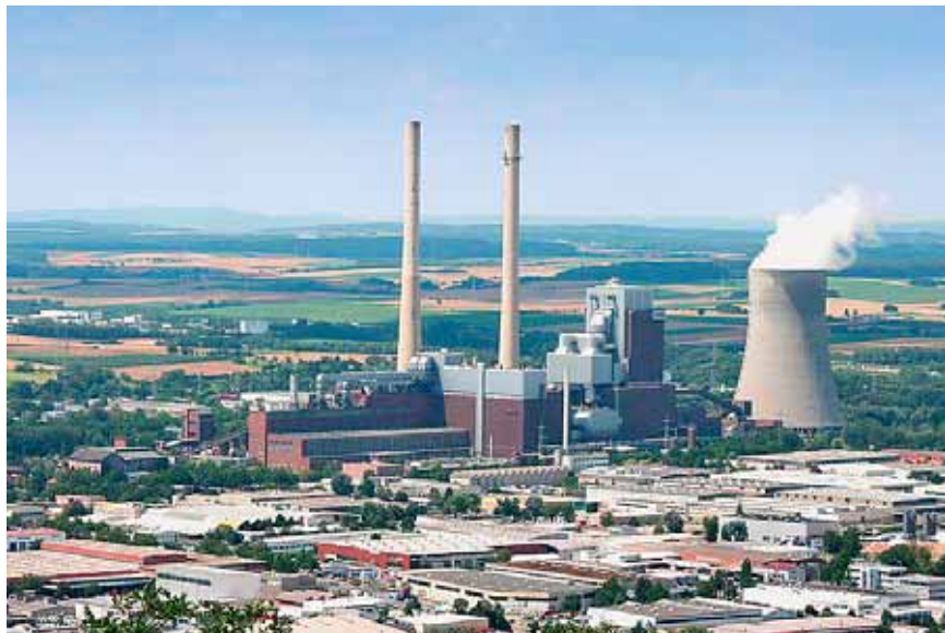
TE Heilbronn, 1 130 MW