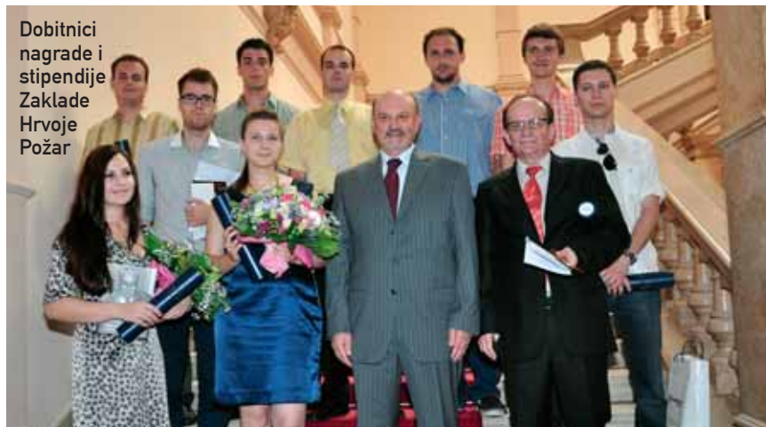
Dobitnici nagrade i stipendije Zaklade Hrvoje Požar