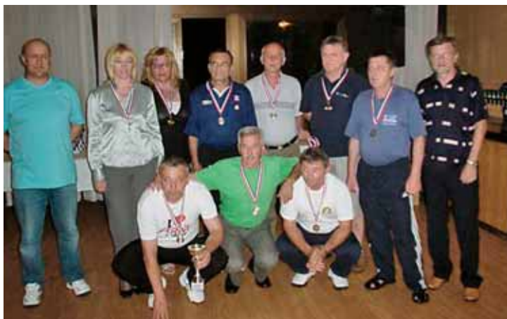
Predstavnici svih pobjedničkih ekipa