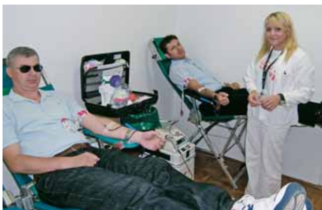
Sve je pod nadzorom!