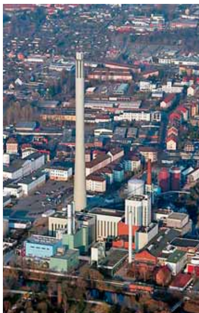
TE-TO Braunschweig-Mitte, 78/320 MW