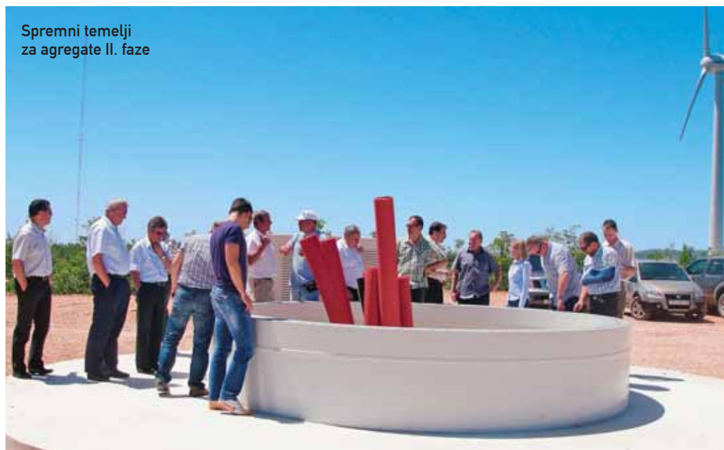
Spremni temelji za agregate II. faze