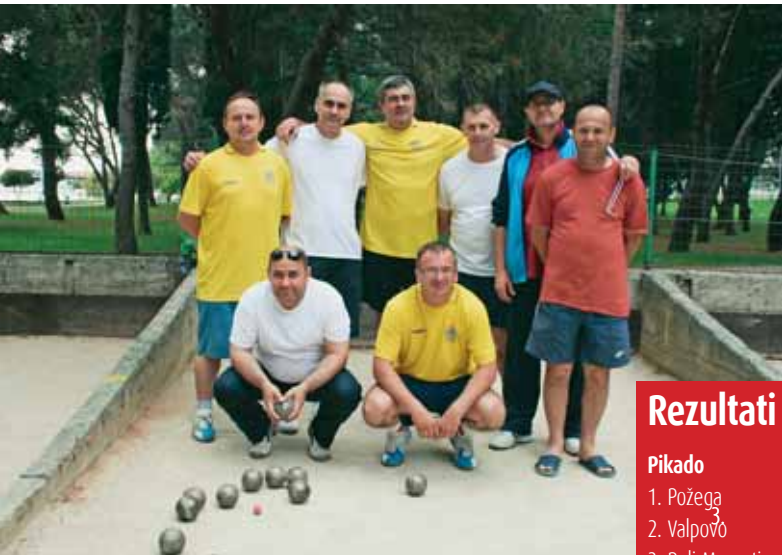
Boćari - pobjednici