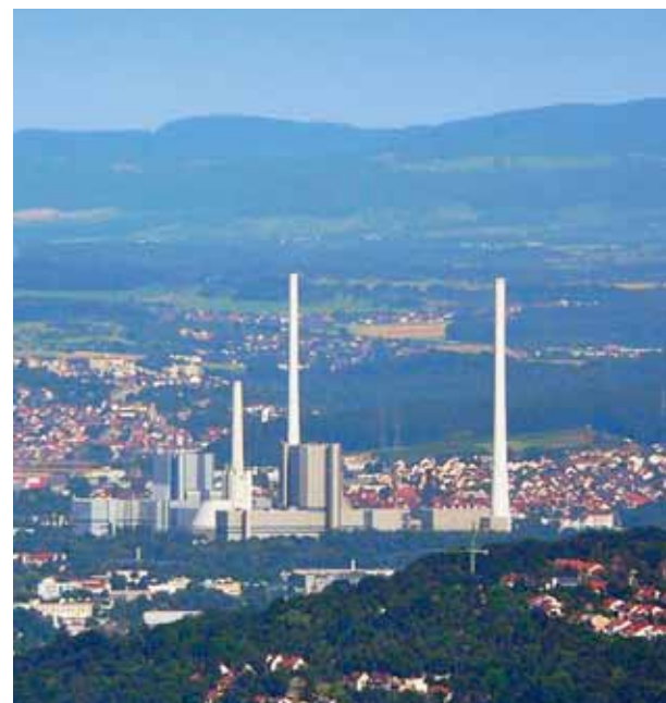
TE-TO Altbach, blizu Stuttgarta, 1 270/560 MW