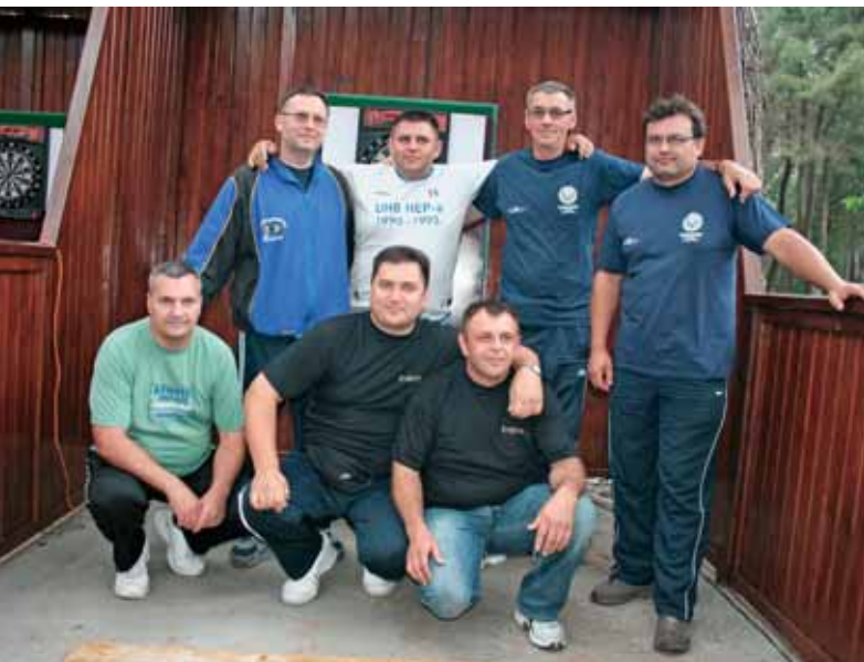
Pobjedničke momčadi u pikadu