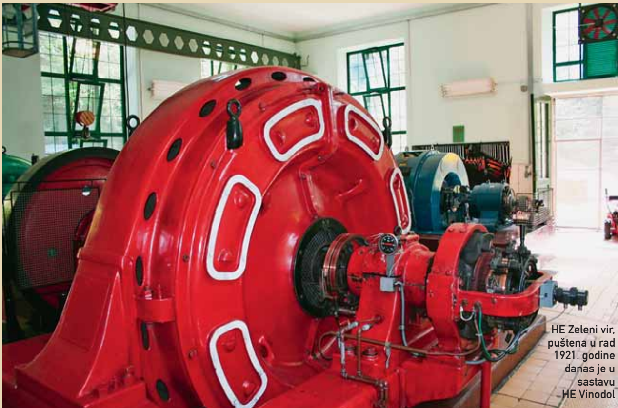
HE Zeleni vir, puštena u rad 1921. godine danas je u sastavu HE Vinodol