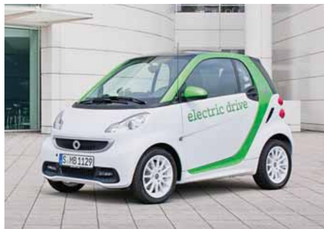
Električna verzija Smart fortwo