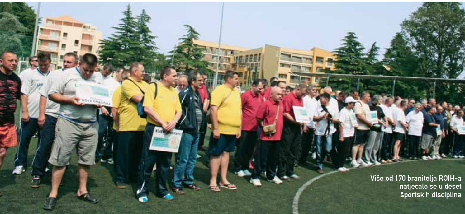
Više od 170 branitelja ROIH-a natjecalo se u deset športskih disciplina

Susretima ROIH-a, završena su kvalifikacijska natjecanja u svim regionalnim odborima. U listopadu slijedi Memorijal Branka Androša, s ovogodišnjim domaćinom ROIH-om.