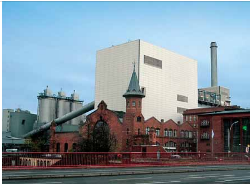
TE-TO Moabit, Berlin, 151/240 MW

TE Plomin C nije jedina elektrana koju trebamo izgraditi do 2020. godine, a i ostale novoizgrađene konvencionalne elektrane također će biti potpora elektranama na obnovljive izvore energije. Podsjećam da smo prema Strategiji energetskega razvoja Hrvatske, počevši od 2010., trebali sustav dograđivati s po 400 MW godišnje. Mi smo do sredine 2012. izgradili vjetroelektrane i HE Lešće, ukupno približno 200 MW, a trebalo je do tog doba biti izgrađeno već 1 000 MW. Hoćemo li izgradnju TE Plomin C proglasiti prekasnom pa ju niti ne započeti? A... gdje će nam biti kraj?