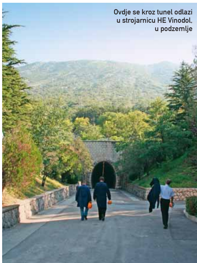
Ovdje se kroz tunel odlazi u strojarnicu HE Vinodol, u podzemlje