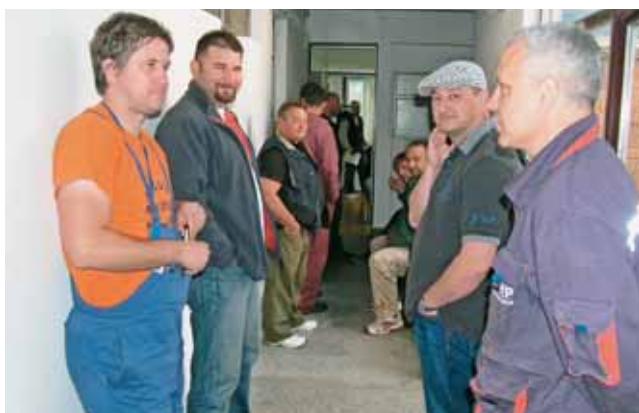
Zaposlenici TE Sisak čekaju u redu za svoje humano djelo

Veliki posao odradila je i voditeljica djelatnosti darivanja krvi pri Crvenom križu u Sisku Željka Haračević, kao i ljubazno osoblje Hrvatskog zavoda za transfuzijsku medicinu grada Zagreba, kojima ovom prigodom zahvaljujemo i poručujemo - veselimo se novom susretu.