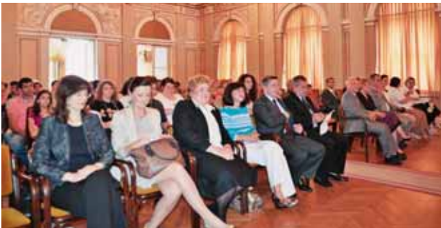
Svečanost dodjele nagrade HEP-a Imam žicu održana je u varaždinskom Hrvatskom narodnom kazalištu, kulturnom mjestu baroknog grada