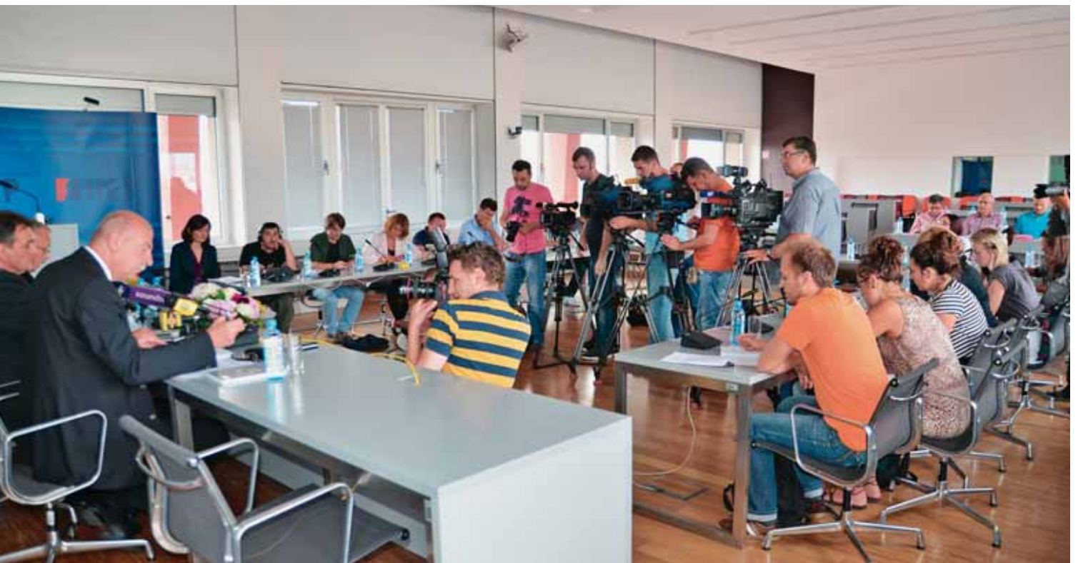
Pitanja novinara odnosila su se na korištenje ugljena ili plina, dobivanje suglasnosti Republike Slovenije, stanju distribucijske mreže, odnosima s lokalnom samoupravom, izvore financiranja, zainteresiranosti RWE-a i emisiju CO 2

- Najvažniji kriterij je najviša razina tehnologije za najvišu razinu ekologije, dali smo najbolje što mi znamo, a tražimo što je u svijetu još bolje - najbolje, zaključno je poručio R. Čačić.