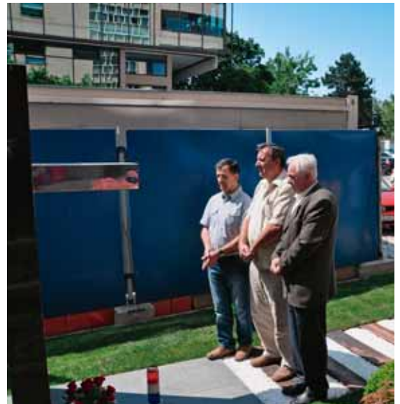
Položenim cvijećem i zapaljenom svijećom uz spomen-obilježje poginulim braniteljima, odana im je zaslužena počast

NAGRADA OPĆINE ŽUPA DUBROVAČKA ZAPOSLENICIMA POGONA HE DUBROVNIK