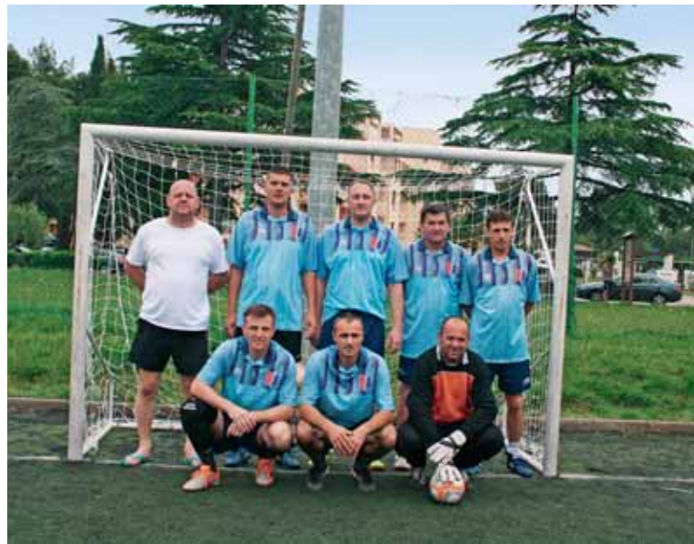
U malom nogometu najbolji su Osječani