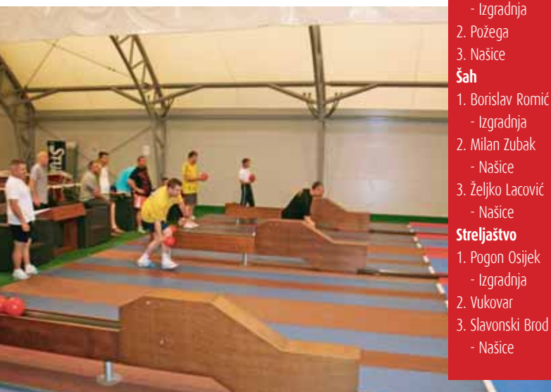
U kuglani se vodila žestoka borba, a trijumfirali su dečki Pogona Osijek-Plin