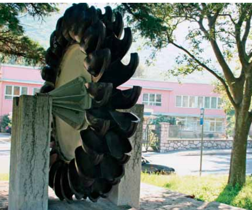
Radno kolo Pelton turbine, nekad pouzdani radnik - danas znakoviti spomenik, ispred poslovne zgrade HE Vinodol u Triblju

Voda iz središnje akumulacije Bajer do strojarnice u Triblju najprije prolazi tunelom dugim 199 metara, potom armiranobetonskim cjevovodom Lič promjera 2,80 metara, duljine 4 920,28 metara. (U međuvremenu je izgrađen i novi cjevovod Lič, položen paralelno sa starim cjevovodom Lič, s tim da oba mogu biti u eksploataciji, a mogu se i fizički odvojiti zapornicama, tako da voda protječe samo jednim od njih. Duljina cjevovoda iznosi 4 881,79 m, promjer je 3,20 m, s padom od 14,20 ‰ do 0,5 ‰ - prosječno 1,8 ‰). Cjevovod Lič prelazi u tlačni tunel Kobiljak - Razromir dug 4 162 metra, kojim voda dolazi do podzemne