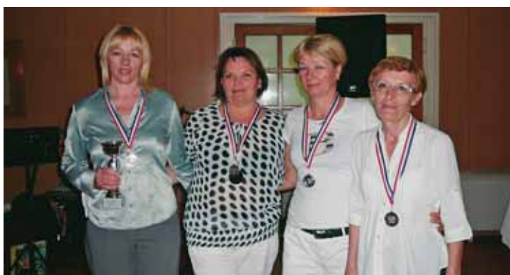
... drugoplasirane - Elektroalmacija Split