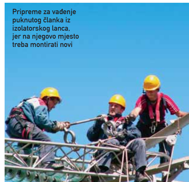
Pripreme za vadenje puknutog članka iz izolatorskog lanca, jer na njegovo mjesto treba montirati novi