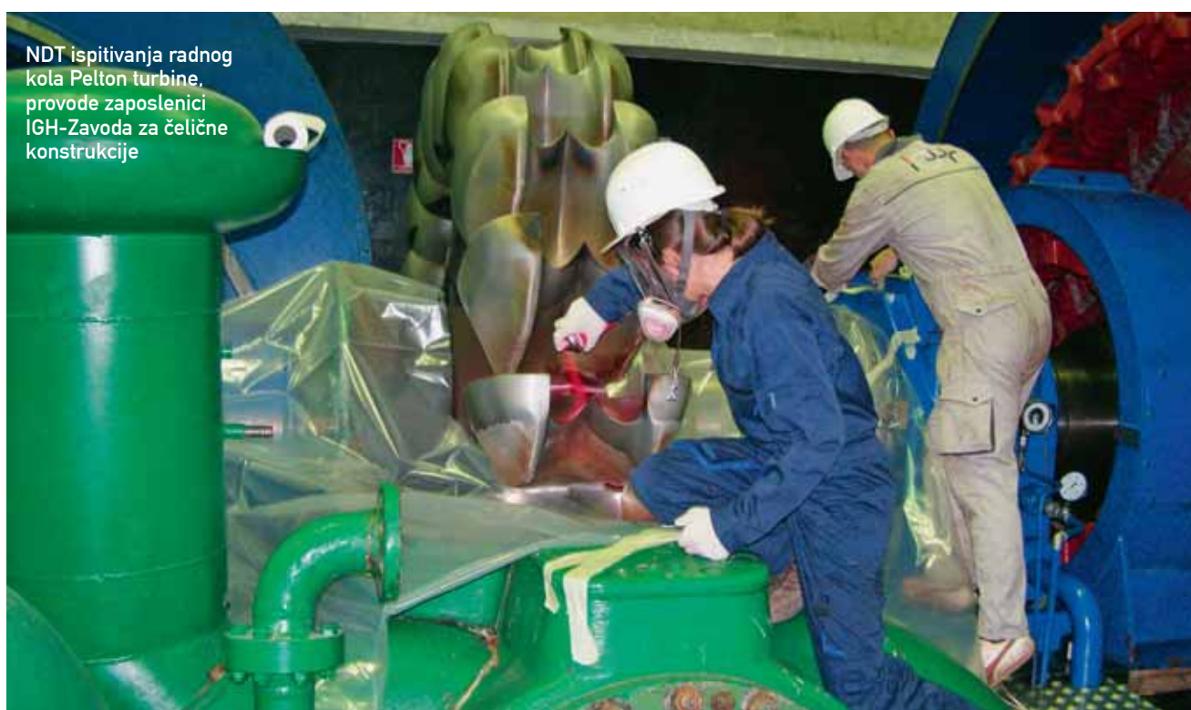
NDT ispitivanja radnog kola Pelton turbine, provode zaposlenici IGH-Zavoda za čelične konstrukcije