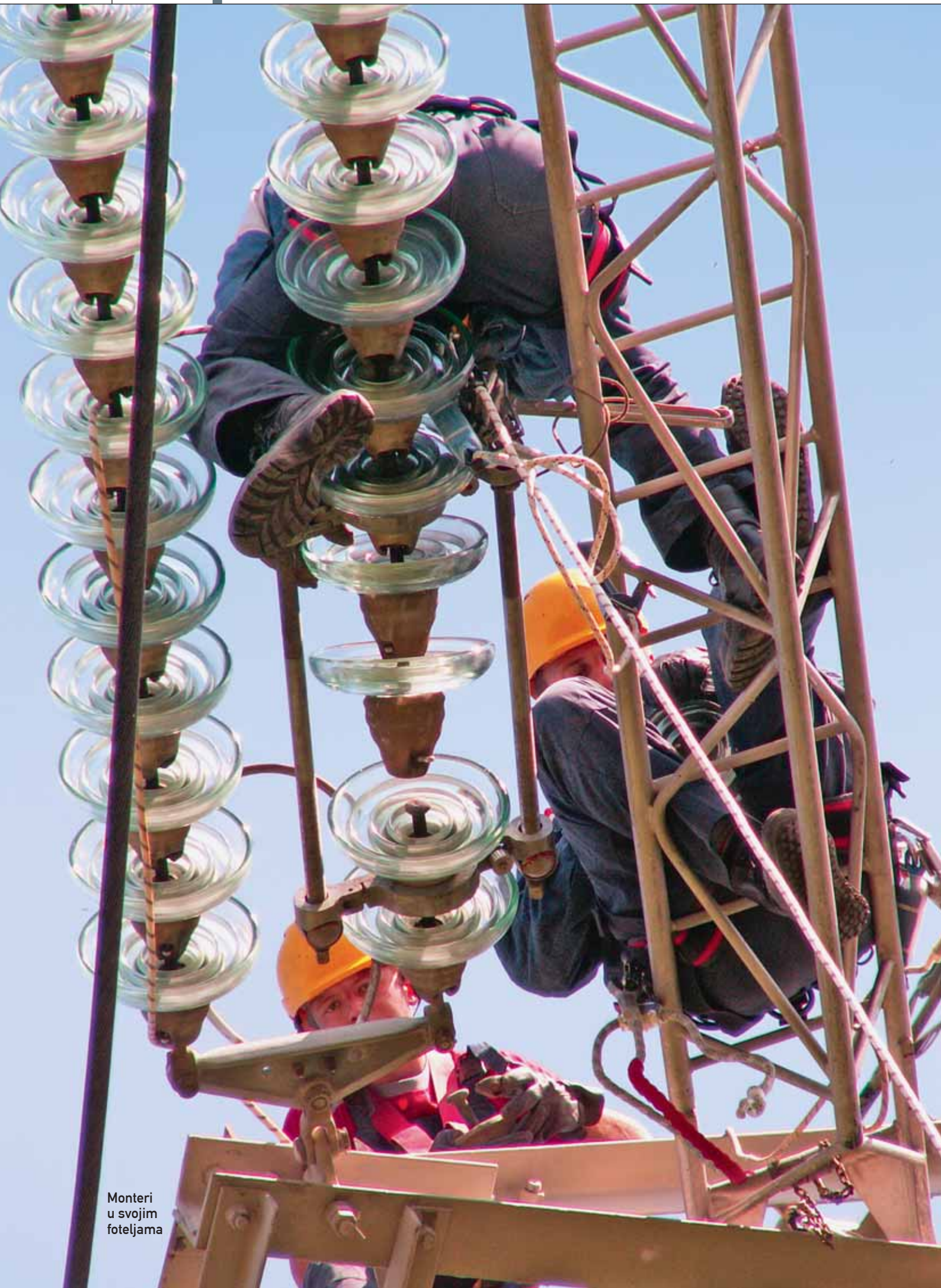
Monteri u svojim foteljama