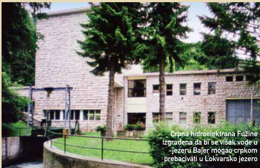
Crpna hidroelektrana Fužine izgrađena da bi se višak vode u jezeru Bajer mogao prebacivati u Lokvarsko jezero

raport: Druže inženjeru. Obavještavam vas da je naša brigada izvršila zadatak na nabijanju gline u klinu brane pet i pol sati prije roka!"