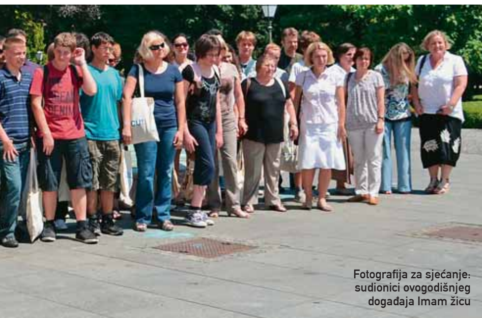
Fotografija za sjećanje: sudionici ovogodišnjeg događaja Imam žicu

Iza prigodnih obraćanja, uslijedio je najsvečaniji trenutak Događaja - uručenje 35 nagrada učenicima osnovnih i srednjih škola.