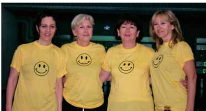
Elektra Zadar - pobjednice u kuglanju i...