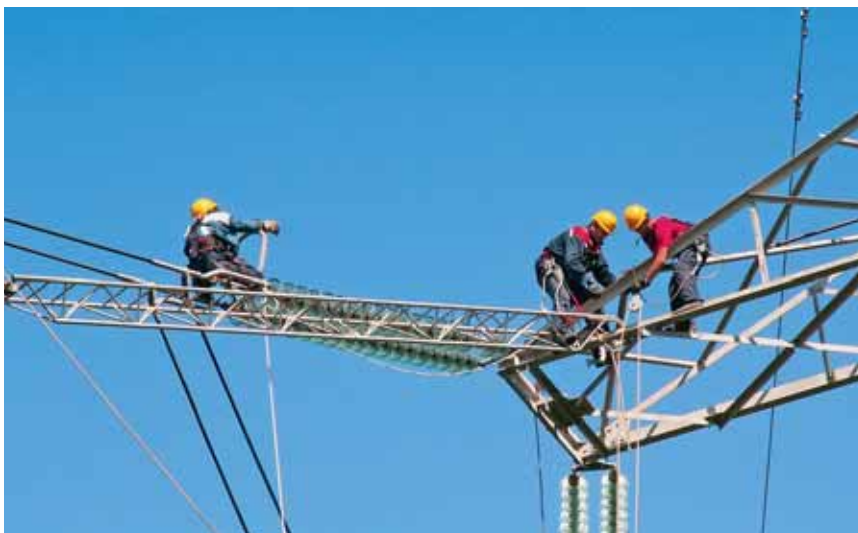
Sve se na stup podiže ručno, preko koloture i užeta, jer se na tom terenu nije moglo računati na Palfinger s dizalicom

Oni su optimisti i nadaju se skorašnjem pomlađivanju ekipe, uzdaju se u Upravu HEP-a i najavljuju kadrovsku obnovu. Nadaju se da će to biti što prije, jedni će uskoro u mirovinu, a drugi možda u uklopnicu trafostanica, jer zbog strogih zdravstvenih kriterija neće više smjeti penjati se u visine čeličnih divova poput ovoga. Također, nadaju se i novim terenskim vozilima, jer postojeća su odradila svoje i skuplji je njihov popravak i održavanje od onoga što vrijede, a svakim su danom sve manje pouzdana.