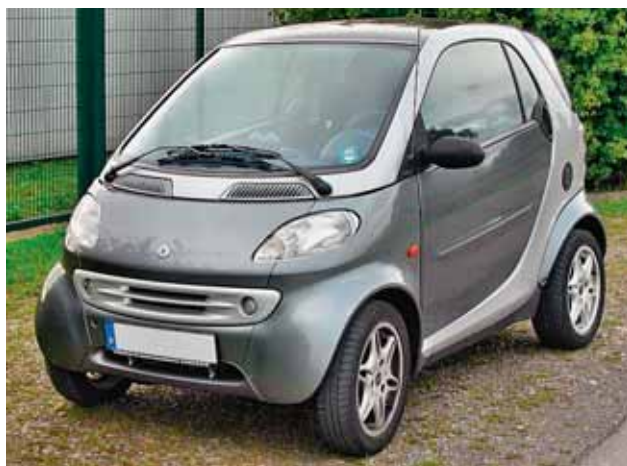
Dizelska verzija Smart fortwo

Međutim, u slučaju teško zamislive, ali ipak pretposta- vimo, naglo rastuće i masovne primjene električnog automobila, moguće je zamisliti brži rast ukupne po- trošnje električne energije (zbog toga) od rasta udjela obnovljivih izvora u proizvodnji električne energije pa bi to moglo prouzročiti povećanje emisija. Za promet se u svijetu koristi 30 posto svekolike finalne energije, pretežito u obliku tekućih goriva, a 20 posto svekolike finalne energije u električnom je obliku i u tomu je zanemariv udjel za promet (željeznički, na elektrificira- nim prugama, manje od dva posto). Stoga, zamišljamo li doista radikalnu supstituciju goriva za kopnena prometala električnom energijom, približno 2/3 od